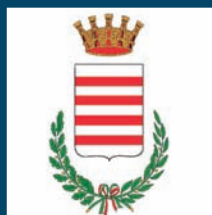
COMUNE DI BARLETTA